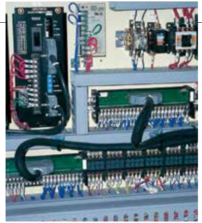
※サイズによって難燃レベルが異なります。テクニカルデータの“難燃性”をご参照ください。 Flame resistance level of cable varies according to size. Refer to "Flame resistance" in [ Technical data ] given below.